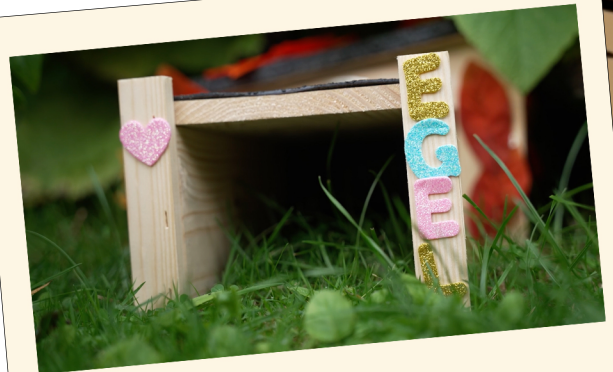
Het egelhuisje is klaar om bewoond te worden!